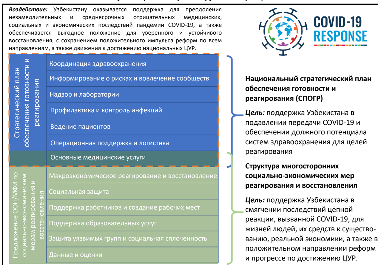
График: Воздействие и цель оказания участвующими многосторонними партнерами поддержки Узбекистану по борьбе с коронавирусной инфекцией COVID-19

Данный отчет представляет собой прямой ответ на запрос со стороны Правительства. Данный отчет подготовлен с учетом доклада Генерального секретаря ООН «Общая ответственность, глобальная солидарность» и соответствующих «Руководящих принципов ООН для немедленного социально-экономического реагирования на COVID-19» под общим руководством Постоянного координатора ООН, при координации со стороны Всемирной организации здравоохранения (ВОЗ) мер реагирования в области здравоохранения, а также при руководящей технической роли Программы развития ООН (ПРООН) по вопросам социально-экономического реагирования. Помимо этого, отчет также основывается на соответствующих решениях в области политики участвующих МФИ в части реагирования на COVID-19.